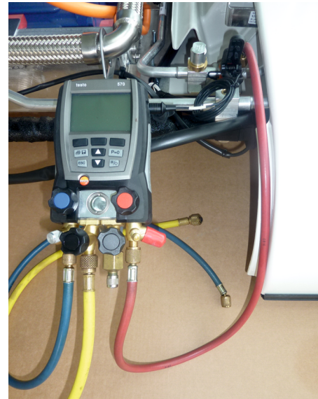
Fig. 2: Connecting the digital manifold

Regardless of the charging station or the charging manometer, which is connected to the compressor and intended for charging the equipment, the digital manifold is connected to the equipment itself to check subcooling.