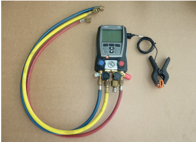
Fig. 1: Digital manifold

To check the prescribed amount of charged refrigerant, ideally a digital manifold is used which has an external temperature sensor (for example, manufactured by Testo or Refco).