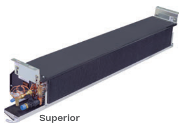
Superior Portapaquete CC430 P2/P3