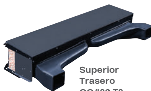
Superior Trasero CC430 T3