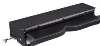
Inferior Trasero CC430 P3/T3